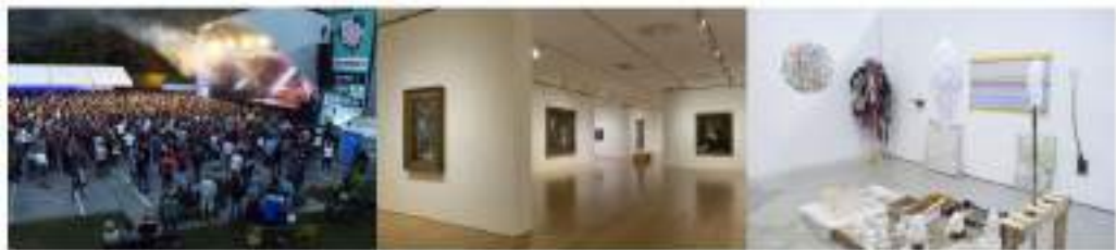
BBK MUSIC LEGENDS → Un formato más académico y exigente de grandes figuras de jazz, blues, rock... visitando las instalaciones del Centro Cívico BBK, en medio de la KULTURTXE con el BBK Music Legends Festival.