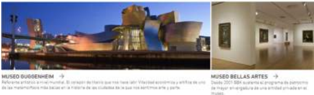
MUSEO GUGGENHEIM → Referente artístico a nivel mundial. El corazón de Bilbao que nos hace vivir. Vitalidad económica y artística de uno de los metamorfosis más bellas en la historia de las ciudades de la que nos sentimos arte y parte.

Por disciplinas, el 52% se han concentrado en exposiciones y museos. De ellas, 830.000 han participado en los espacios didácticos y programas educativos del Museo Guggenheim y del museo de Bellas Artes, reforzando la colaboración de BBK con los grandes referentes culturales del territorio.