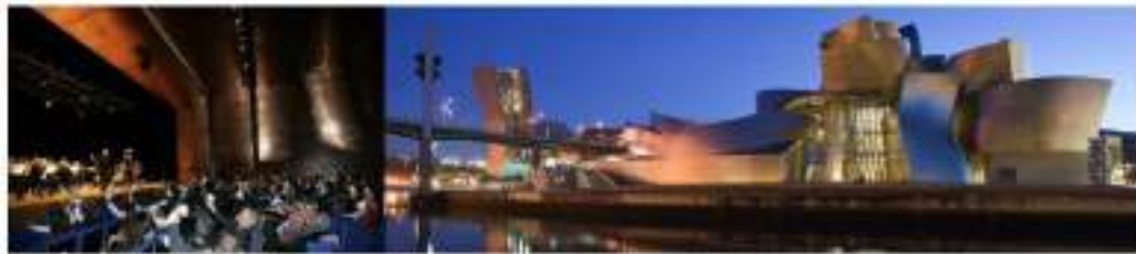
BOS, EDS, ABAO-OLBE → Para que la música llegue a todo el mundo. Para promover la formación musical de las y los jóvenes vascos y de sus familias. Para todos y todas.

Destacan así mismo los más de 450 eventos culturales programados por toda Bizkaia tanto a través de agendas culturales municipales como mediante el impulso de actuaciones y programas de promoción del folklore y la cultura vascas, que han registrado conjuntamente 461.000 participantes en 2019.